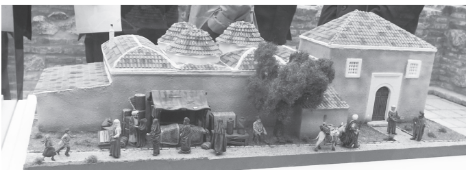
A török fürdő makettje