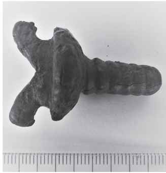
A csabai kápolnavivők hagyatéka lehet ez a középkori csavar

A kút mellett a síneken keresztül kis átjáró út vezetett a közeli cigánytelepre. Itt kb. 20 kis kunyhó, putri készült nagyjából félkörben. Egyforma módon épültek ezek a kis hajlékok. Rudakat vertek le, a közét ágakkal befönték és besározták, tetőt szerkesztettek fölé. A nagyjából 3x3 m-es belső helyiség volt a lakószoba. Nyugati oldalán egy kívülről fűthető kemenca adta a meleget, körülötte aludt az egész család, legalább 5-6 ember. A nagyobb családoknak kicsit nagyobb kunyhót